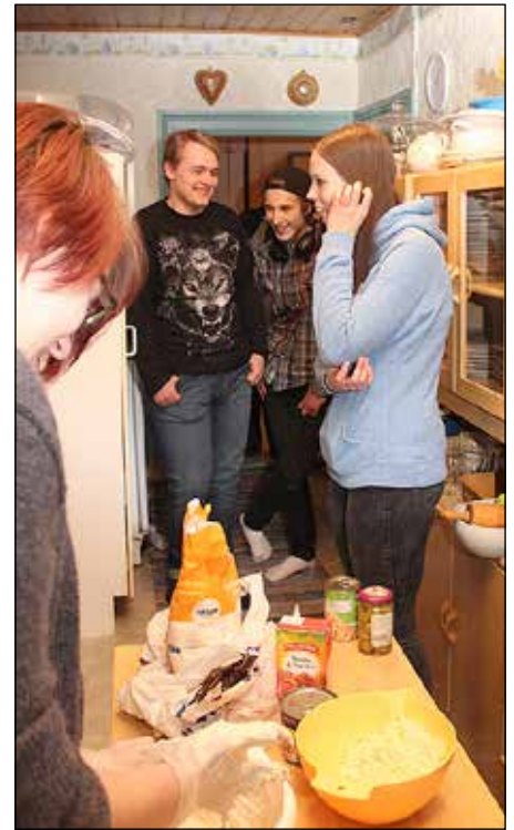
Sinervon keittiö käy välillä ahtaaksi, kun nuoret kokkaavat.

Ensimmäisessä kokoontumisessa päätettiin, että perjantai on ihan hyvä ilta kahvilalle, kun ei tarvitse tehdä läksyjä ja herätä seuraavana aamuna aikaisin. Koska osa kylän nuorista palaa perjantaisin muualta opiskelemasta, valittiin toiseksi kokoontumispäiväksi lauantai, jotta perjantaina matkustavatkin pääsevät välillä mukaan.