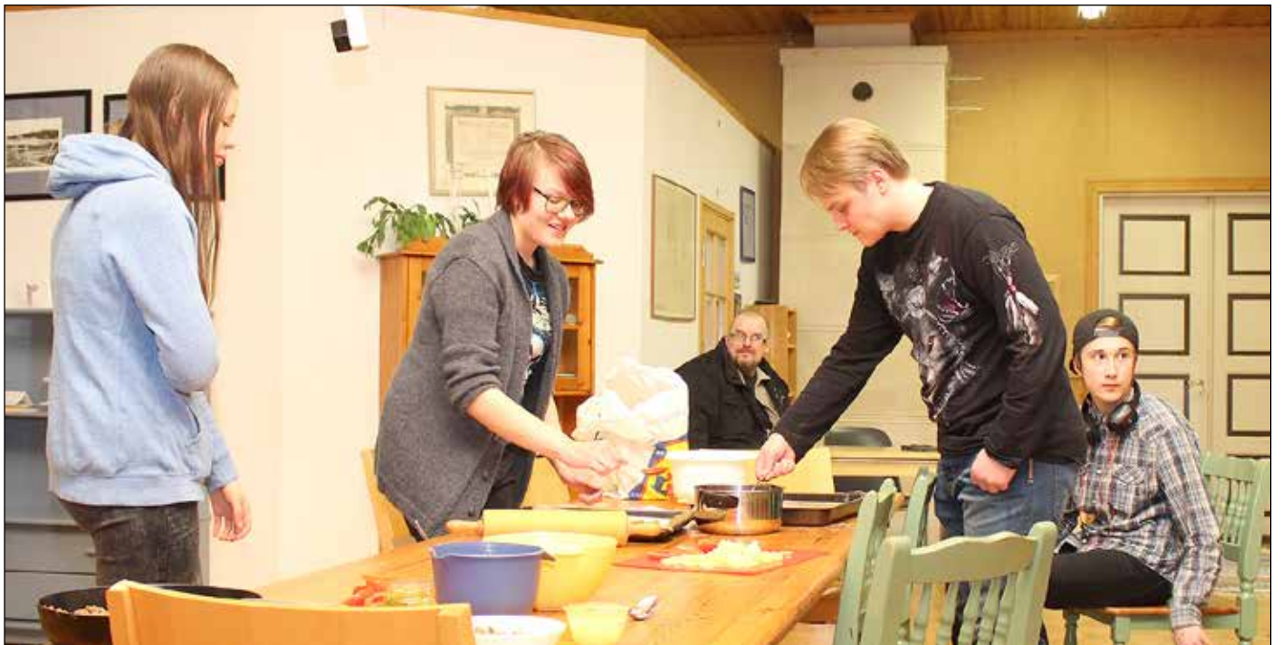
Nuorisokahvila kokoaa Sinervolle perjantai- tai lauantai-iltoina vaihtelevan määrän Velkuan ja Livonsaaren 13–18-vuotiaita nuoria. Nuorten kahvila-illoissa laitetaan aina itse iltapalaa kuten vaikkapa pitsaa tai lämpimiä leipiä.