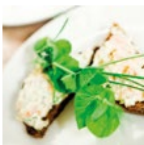
Korkeatasoiset hotelli- ja ravintolapalvelut