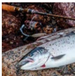
Kokous-, kalastus- ja luontopaketit