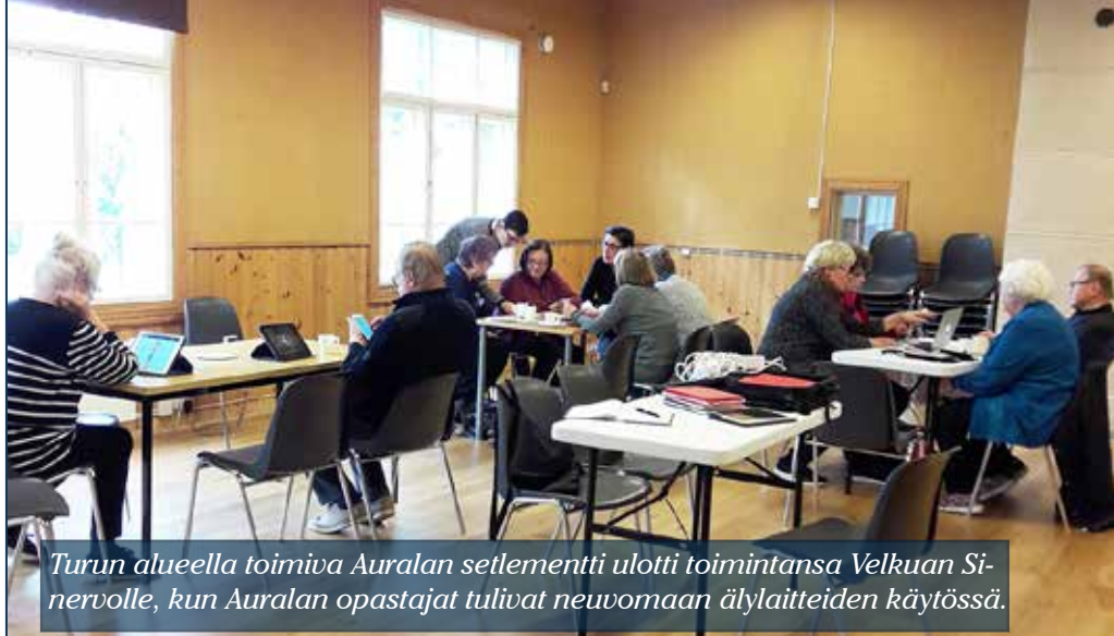
Turun alueella toimiva Auralan settlementti ulotti toimintansa Velkuan Sinervolle, kun Auralan opastajat tulivat neuvomaan älylaitteiden käytössä.

Yli 40 prosenttia 65–74 vuotiasta suomalaisista senioreista käyttää nettiä päivittäin ja 21 prosenttia samasta ikäluokasta on ostanut jotain verkko-