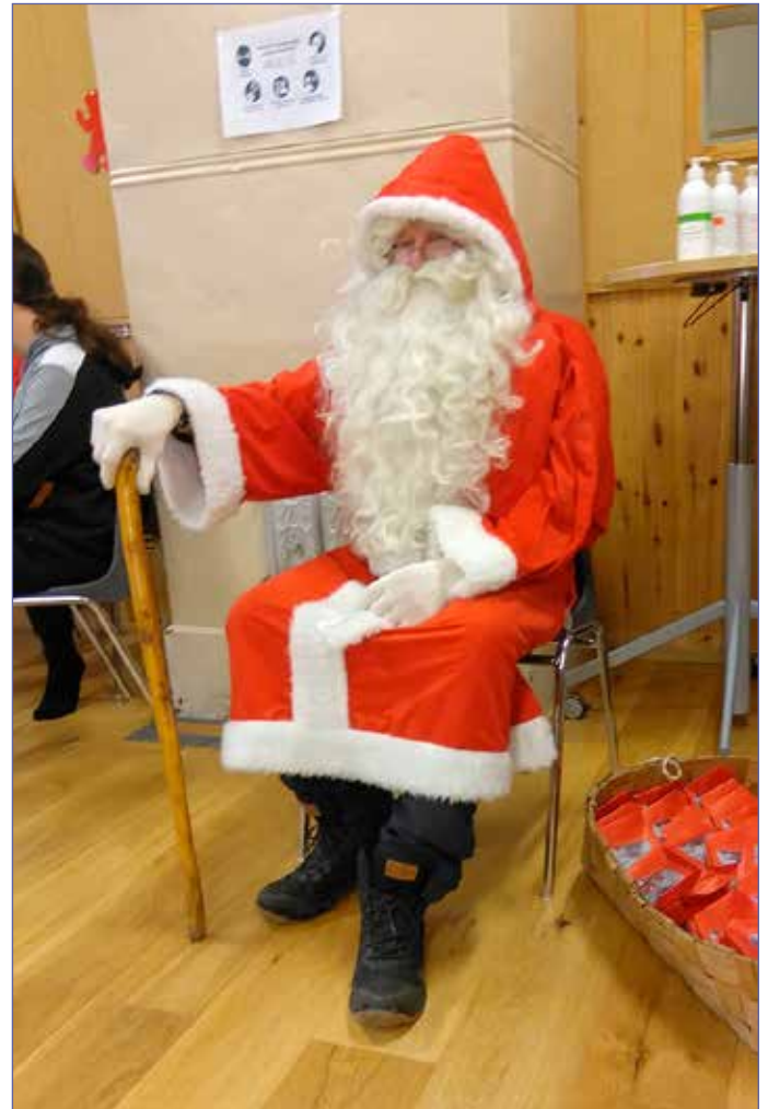
Joulupukilla on ollut tapana piipahtaa Saariston joulunavauksessa Sinervon talolla.

Joulupukkikin lupaili tulla käymään joskus puoli kahden aikaan, se kuulemma sopii hänen aikatauluunsa.